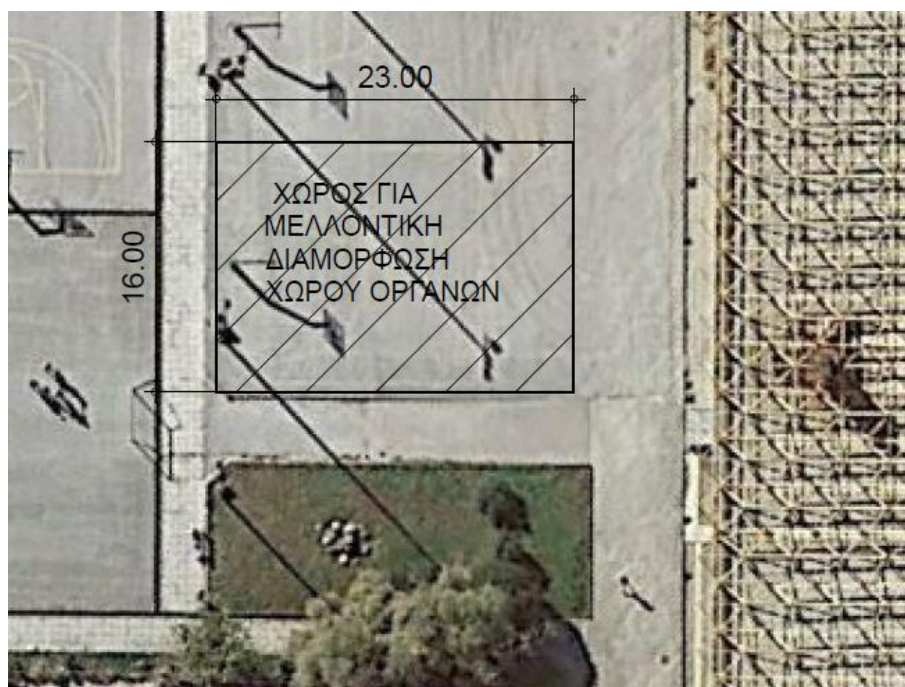
Εικόνα 3: Προτεινόμενος χώρος οργάνων ανοιχτού χώρου στο Ποσειδώνιο Αθλητικό Κέντρο.

Στον χώρο που ορίζεται στην Εικόνα 3, θα τοποθετηθούν όργανα γυμναστικής εξωτερικού χώρου.